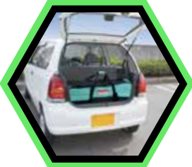
Praktisch mit dem Fahrzeug mitzunehmen.