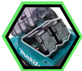
Zwei Akku-Steckplätze zur Verlängerung der Laufzeit.

Leerlaufdrehzahl : 2'500-3'200 U/min Schnittbreite : 48 cm Einstellung Schnitthöhe : 20-100 mm Autonomie : 2'600 m 2 (2x BL4080F) Grasfangkorb : 62 L Gewicht mit Akku : 33 kg