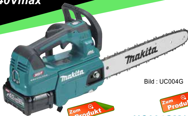
Bild : UC004G

Kettengeschwindigkeit : 24.8 m/sec. Kettenteilung : 3/8" / Nutbreite : 1.3 mm Tank Kettenöl : 0.2 L Maximale Leistung : 1'600 W Gewicht mit Akku : 4.4 kg