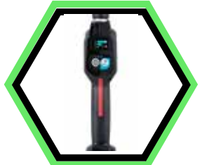
Stufenlose Geschwindigkeit mit Schalter regulierbar.